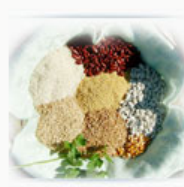
Cereales y Legumbres