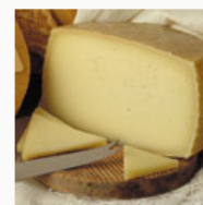
Quesos y mantequillas