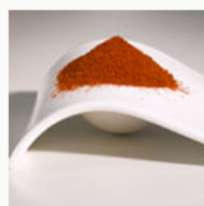
Condimentos y especias