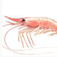
Láminas de Especies Pesqueras