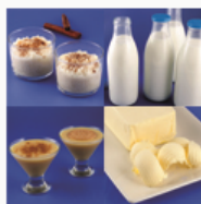
Leche y lácteos