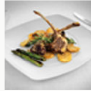
Cordero y cabrito