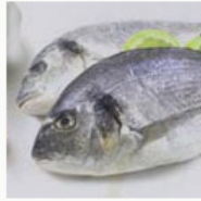
Pescados y mariscos