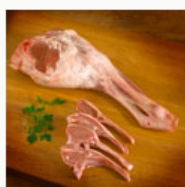
Carne y embutidos