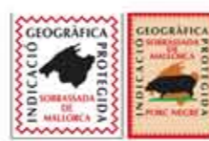
Consejo Regulador I.G.P. SOBRASADA DE MALLORCA Sobrasada de Mallorca ISLAS BALEARES (IGP)