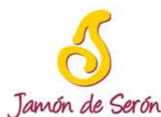
Jamón de Serón ANDALUCÍA (IGP)