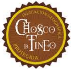
Chosco de Tineo ASTURIAS (IGP)