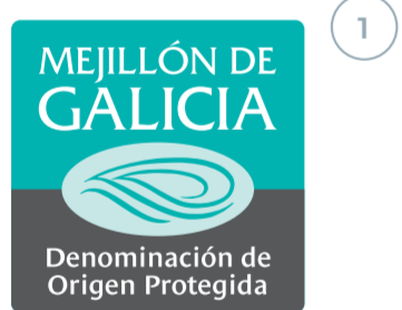
Mejillón de Galicia (DOP) GALICIA