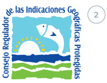
Caballa de Andalucía (IGP) ANDALUCÍA